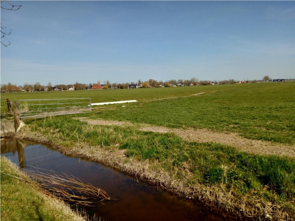
Foto 1: impressie van het plangebied. Het grootste deel van het plangebied bestaat uit intensief beheerd grasland.