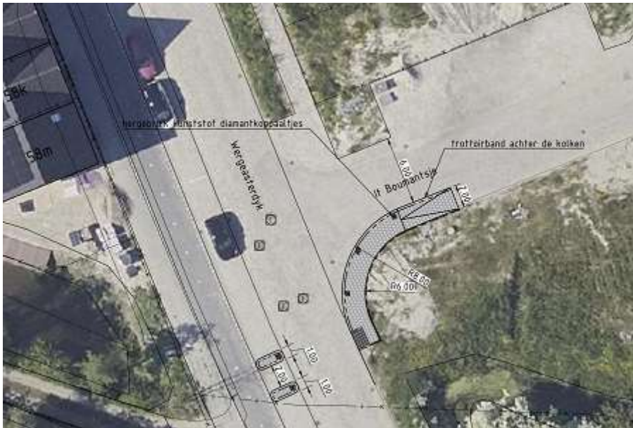
Locatieaanduiding bij vraag 5

6) IKC Teresa: onoverzichtelijke en gevaarlijke situatie tijdens halen en brengen van kinderen. Het probleem is bekend. Er zijn verschillende maatregelen mogelijk, maar door de beperkte ruimte moeten we dit goed onderzoeken. Er is geen tijdelijke maatregel om dit probleem op te lossen.