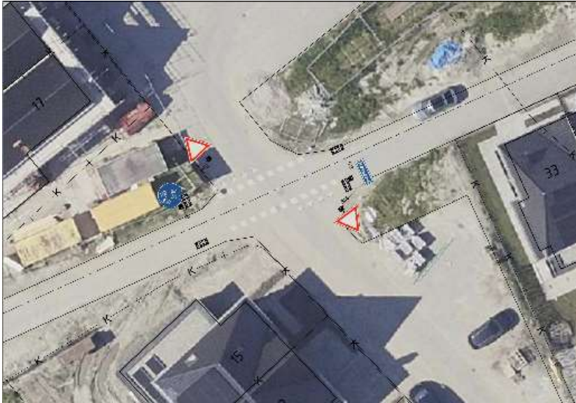
Locatieaanduiding bij vraag 10

11) Is het mogelijk om snelheidsremmende maatregelen bij de Fûgelyk aan te brengen? Bloembakken, verkeersdrempel en borden worden aangebracht.