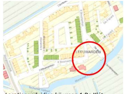
Locatieaanduiding bij vraag 1: De Klút