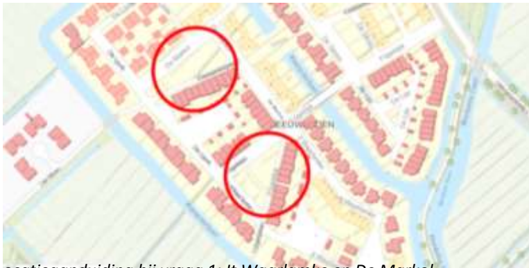
Locatieaanduiding bij vraag 1: It Waarlamke en De Markol

Het bouwafval is inmiddels weggehaald. In fase 1 worden de toekomstige speelterreintjes vlak gemaakt, ingezaaid en op de terreintjes in fase 1 wordt eerst één speeltoestel neergezet. Zie de afbeeldingen voor de locaties.