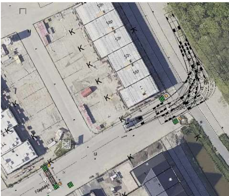
Locatieaanduiding bij vraag 11

11) Is het mogelijk om snelheidsremmende maatregelen bij de Fûgelyk aan te brengen? Bloembakken, verkeersdrempel en borden worden aangebracht.